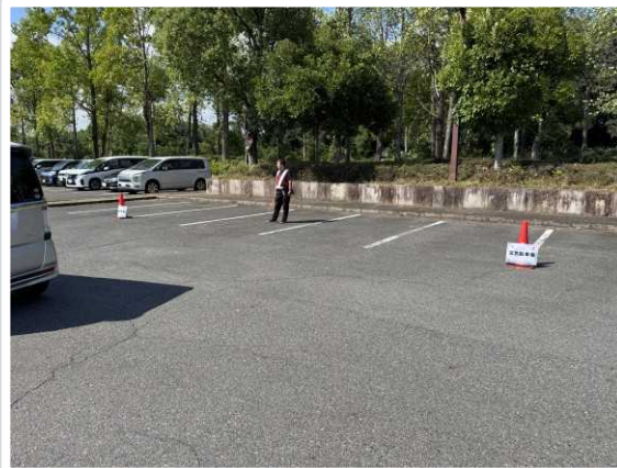
【 東近江市 】 駐車場内の警備員