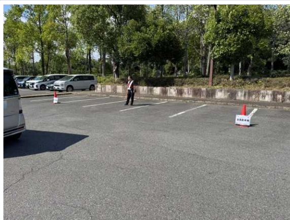
【東近江市】 委託業者