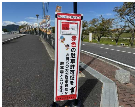
【甲賀市】 駐車場の表示看板