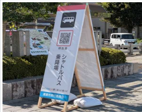
【栗東市】 乗降所看板 時刻表 2次元コード