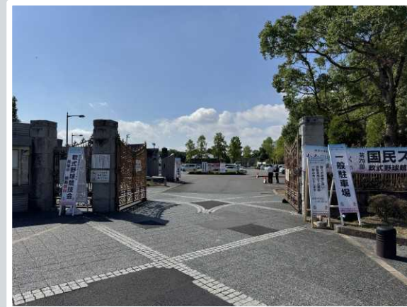
【東近江市】 一般駐車場