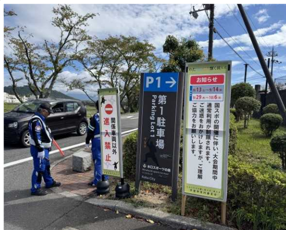
【甲賀市】 駐車場の表示看板