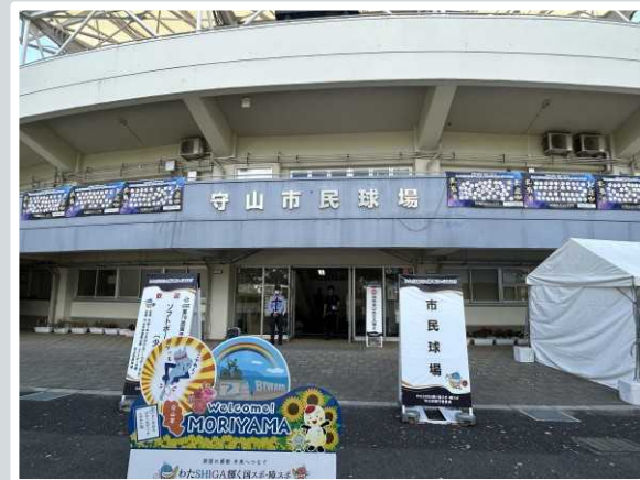
【 守山市 】 ADコントロールの様子