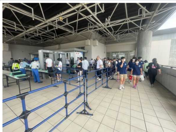
【草津市】 一般観覧者入り口の手荷物検査 の様子