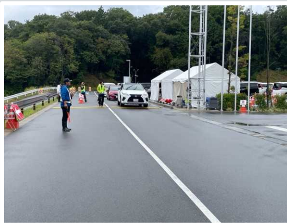
【 大津市 】 駐車場内の警備員