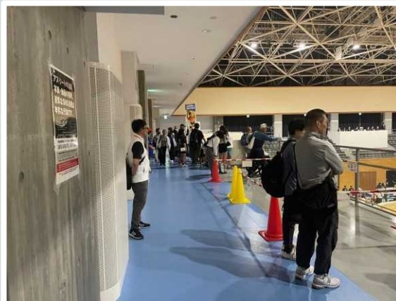
【草津市】 滋賀県警による観客席の警戒の 様子（白ベスト着用）