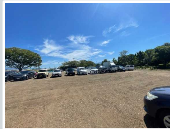
【長浜市】 関係者駐車場