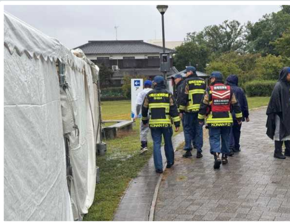
【草津市】 会場内巡回の様子