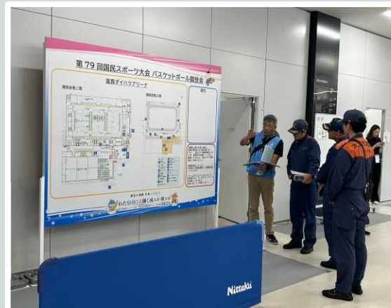
【大津市】 会場内巡回の様子。