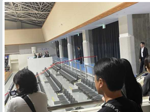
【草津市】 御観覧席周囲の警備の様子