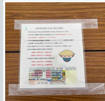
【草津市】 一般観覧者向け、お成り時のお願い