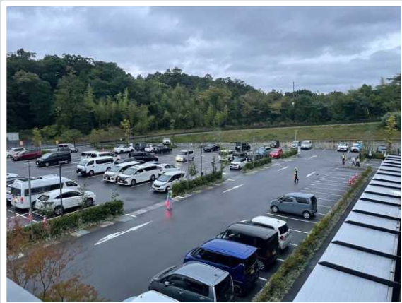
【大津市】 駐車場係員