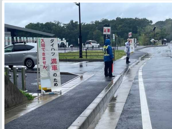
【大津市】 会場駐車場入口