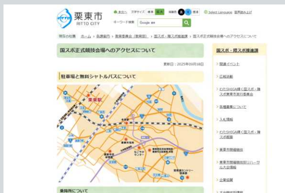
【栗東市】 HP 会場へのアクセスの案内