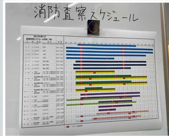
【草津市】 消防査察スケジュール