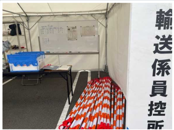
【草津市】 輸送係員控所