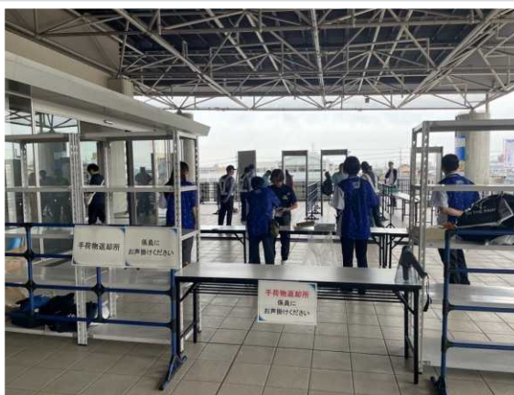
【草津市】 一般観覧者入り口の手荷物検査 （荷物預かり）の様子