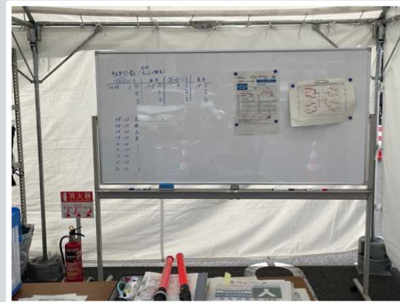
【草津市】 輸送係員控所