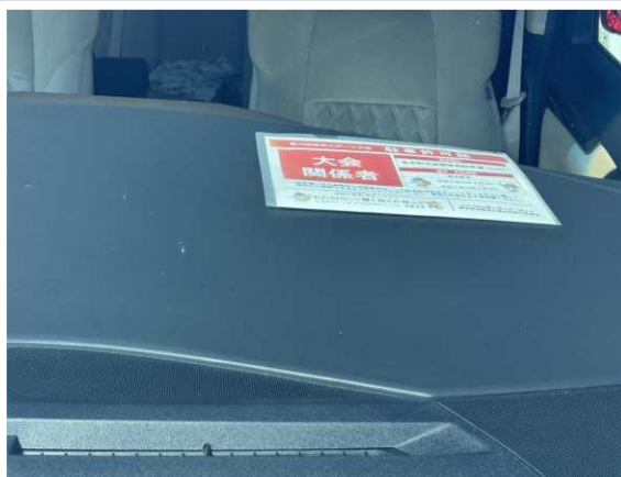
【東近江市】 駐車許可証