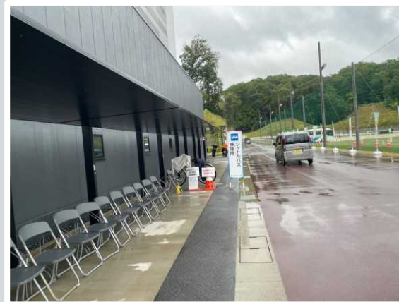
【大津市】 シャトルバス乗り場