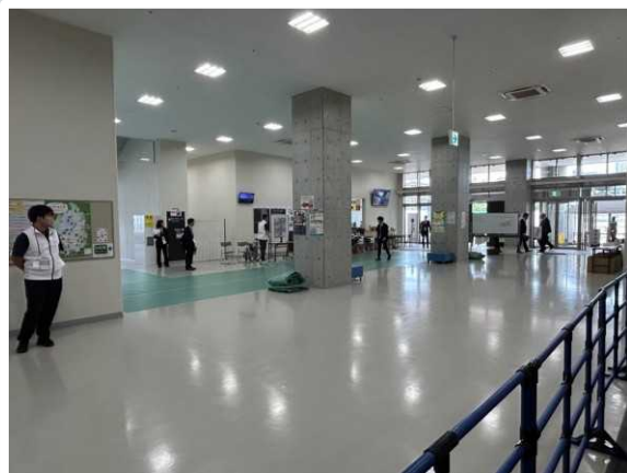
【草津市】 高円宮殿下御着直前の受付周辺の 警備の様子