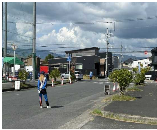
【 守山市 】 駐車場入り口の警備員