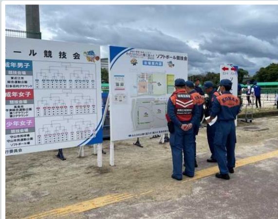
【草津市】 会場内巡回の様子