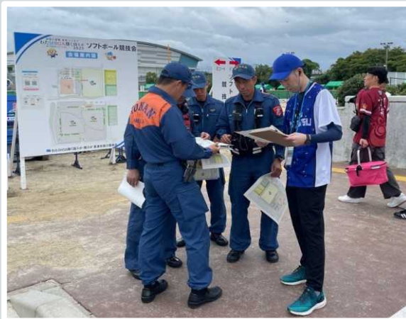
【草津市】 消防と会場スタッフ打合せの様子