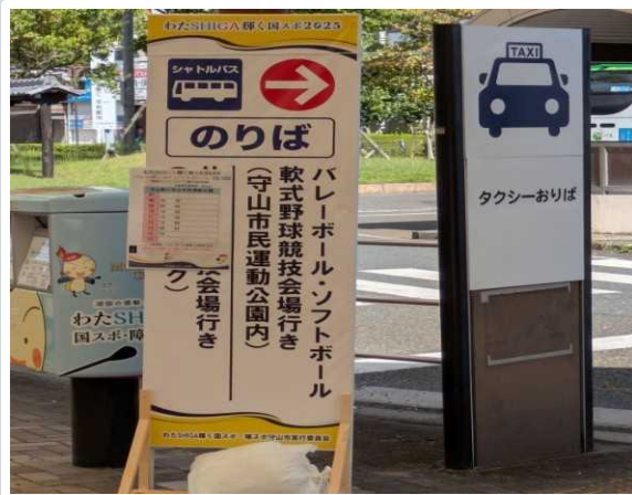
【守山市】 会場⇄駅シャトルバス乗り場案内