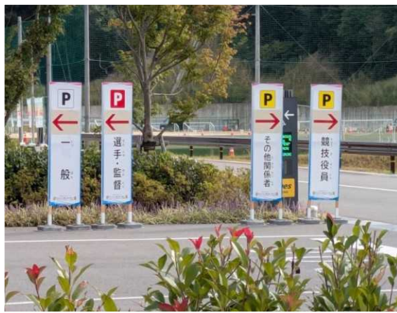
【大津市】 駐車場の案内表示看板