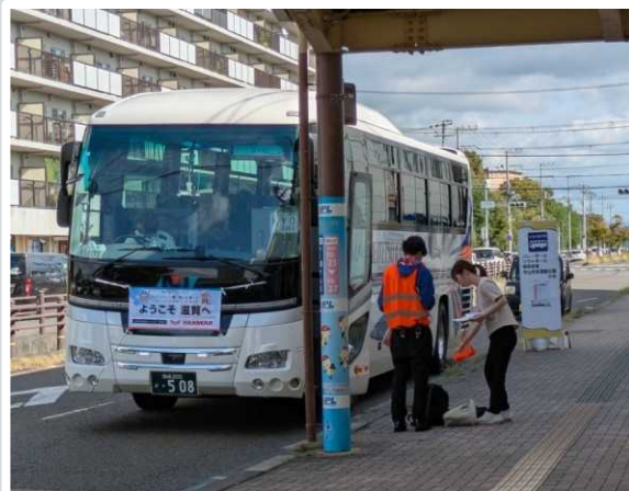
【守山市】 駅前シャトルバス乗降所