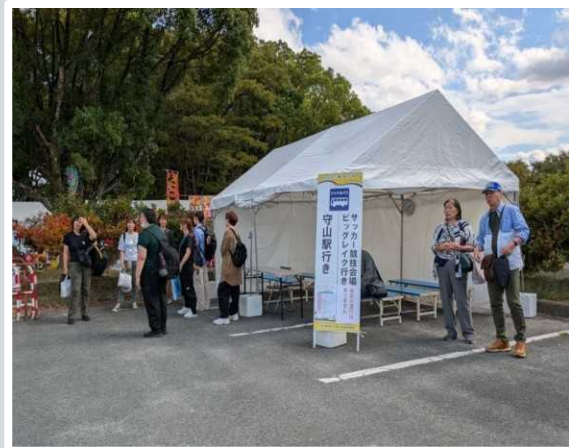
【守山市】 会場内シャトルバス乗り場