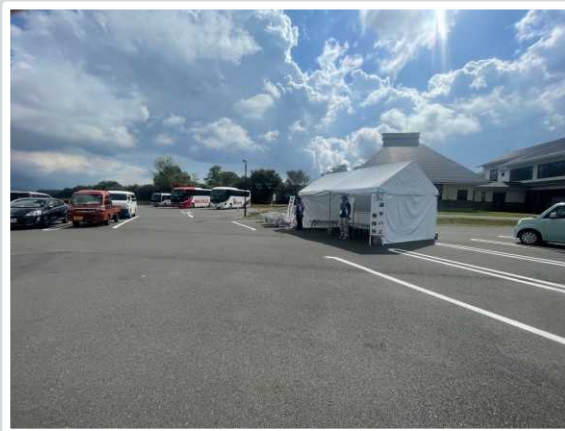
【高島市】 選手バス乗降所