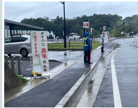
【 大津市 】 駐車場入り口の警備員