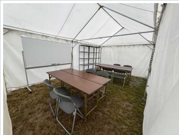
【草津市】 消防警備本部